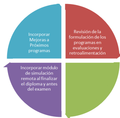
Figura 6. Desafíos

Podemos concluir en esta primera fase que hemos cumplido con los objetivos planteados, más aún nos falta finalizar el programa y por lo tanto el proyecto, siendo nuestros desafíos: