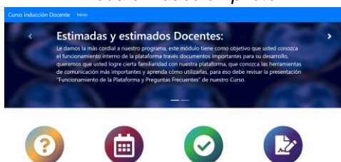
Figura 2. Módulo inducción piloto

Se incorpora al contenido, autoevaluaciones interactivas para la realización autorregulada por parte de las y los estudiantes, consideremos que son adultos profesionales de distintas edades.